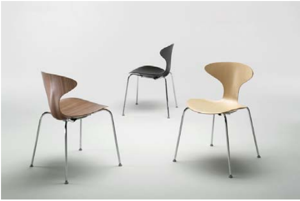
Orbit i valnød, ask og sortbejdet ask

Orbit fås i zebrano-, valnød- og askfiner samt i sortbejdet ask og forhandles i førende møbelforretninger.