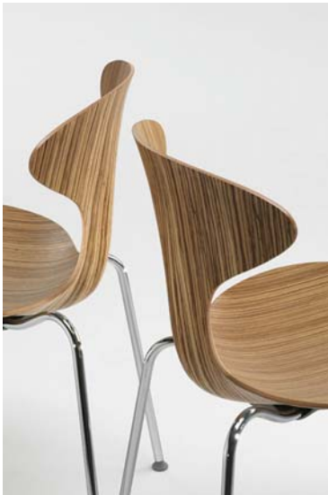
Orbit i zebranofiner

Danerka A/S introducerer ny skalstol, designet af den verdensberømte designer Ross Lovegrove. Stolen; Orbit, er udviklet i samarbejde mellem Bernhardt Design USA og Ross Lovegrove, og som førende producent af moderne skalstole har Danerka A/S fået produktions- og distributionsretten i Europa og Japan.